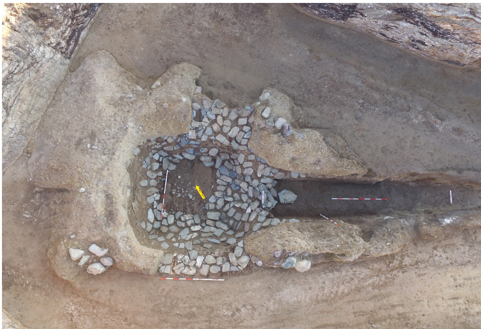
Рис. 4. Могильник Елеке Сазы 3. Курган № 1. Перекрытие могильной ямы и дромос

После окончательного раскопа могильной ямы, было выявлено, что ее размер составил – 2,8×2,55 м, а глубина – 2,6 м. Вдоль всех стенок ямы фиксируются канавки шириной от 0,3 до 0,5 м и глубиной от 0,15 до 0,25 м. Они были вырыты с целью установки жердей-подпорок перекрытия могильной ямы. После их вертикальной установки пустое пространство в канавках было заполнено щебенкой, а затем утрамбовано. Высота жердей, вероятно, равнялась глубине могильной ямы. Дно было специально подготовлено для погребения усопшего. Вначале на материковый слой желтой однородной глины был уложен 5 см слой щебенки. На последнем были зафиксированы фрагменты настила из деревянных досок. Они ориентированы длинной осью по линии юго-восток – северо-запад. В процессе