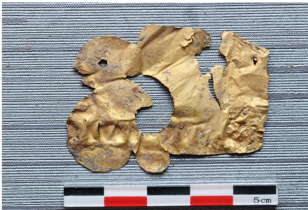
Рис. 5. Могильник Елеке Сазы 3. Курган № 1. Могильная яма. Нашивка. Золото

А на глубине – 1,87 м от нулевой точки, в центре ямы, были зафиксированы фрагменты керамики. На глубине -2,2 м от нулевой точки были зафиксированы кости животных. В южном углу лежали частично разрушенный череп барана и позвонок, а в северном лопатка.