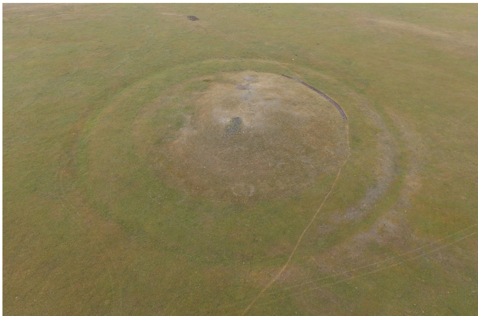
Рис. 1. Могильник Елеке Сазы 3. Курган № 1. Вид до раскопа

сторону. Диаметр округлой в плане площадки – 21 м. В ее северной части фиксируется воронка диаметром – 10 м, глубиной – 0,25 м. (Рис. 1).