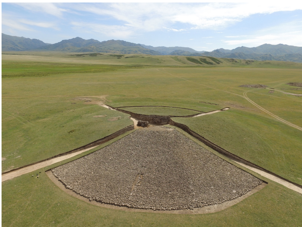
Рис. 3. Могильник Елеке Сазы 3. Курган № 1. Траншеи

Для определения стратиграфии кургана были заложены траншеи по направлениям север–юг и восток–запад, шириной 3 м (Рис. 3).