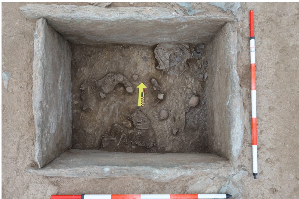
Рис. 6. Могильник Елеке Сазы, группа 6. Курган № 4. Каменный ящик. Погребение

изготовлена из бронзы и золота. После полной зачистки ящика, было выявлено, что его размер по внутренним стенкам составил 1,04×1,27 м, а глубина 0,87 м. На уровне -73 см и до дна по всей площади ящика в беспорядочном положении фиксировались детские кости, фрагменты керамики. А на глубине -84 см от поверхности ящика у северной стенки была зафиксирована вторая серьга с раструбом (Рис. 6).