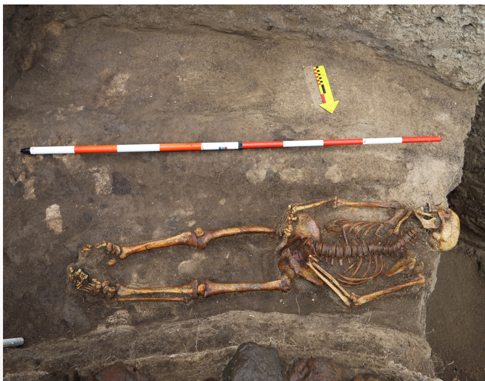
Рис. 2. Могильник Елеке Сазы 3. Курган № 1. Впускное захоронение

В процессе разбора насыпи было выявлено, что под слоем, окатанных речных камней (толщина 0,20–0,25 м) фиксируются каменные плиты средних размеров. В центральной части насыпи, захоронения перекрыто удлиненными крупными плитами поперек длинной оси ямы. Яма ориентирована длинной осью по линии восток–запад. Длина ямы 2,60 м, ширина 1 м. Размер дна ямы составил: 0,60×2,20 м. Усопший лежал на спине, в вытянутом положении, головой ориентирован на запад. Длина скелета: 1,80 м. В процессе расчистки погребения сопроводительного инвентаря найдено не было (Рис. 2).