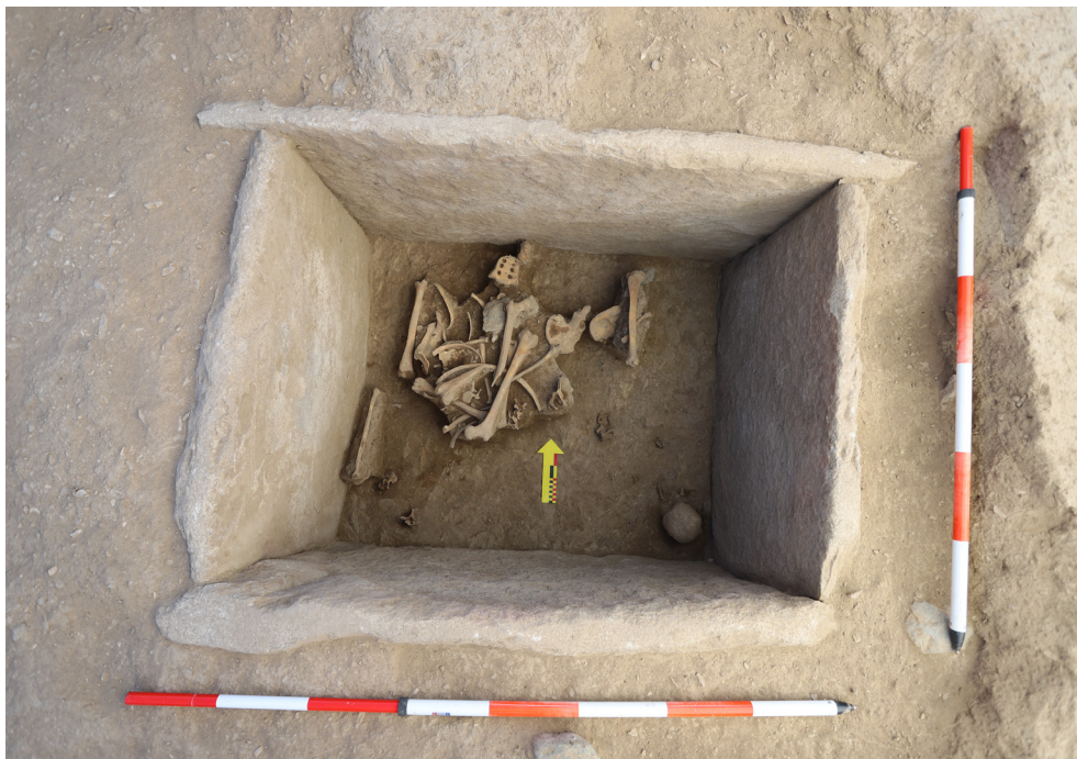
Рис. 7. Могильник Елеке Сазы, группа 6. Курган № 4. Каменный ящик. Погребение

Несмотря на тот факт, что погребения были разграблены, а костяки сильно потревожены, обряд погребения дает возможность предварительно связать курганы с периодом поздней бронзы.